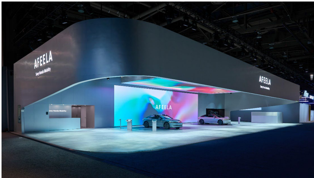
CES® 2025 の Sony Honda Mobility ブース

CES® 2025 の一般公開期間中は、ソニー・ホンダモビリティブースでは、AFEELA1 Signature を展示・紹介しています。また、ブースでは、AFEELA の開発における協業パートナー企業各社を紹介するコーナーや、AFEELA1 の内装に使用している高品質な機能性素材を紹介する端末を設置しており、SHM が描くモビリティの未来像を紹介しています。