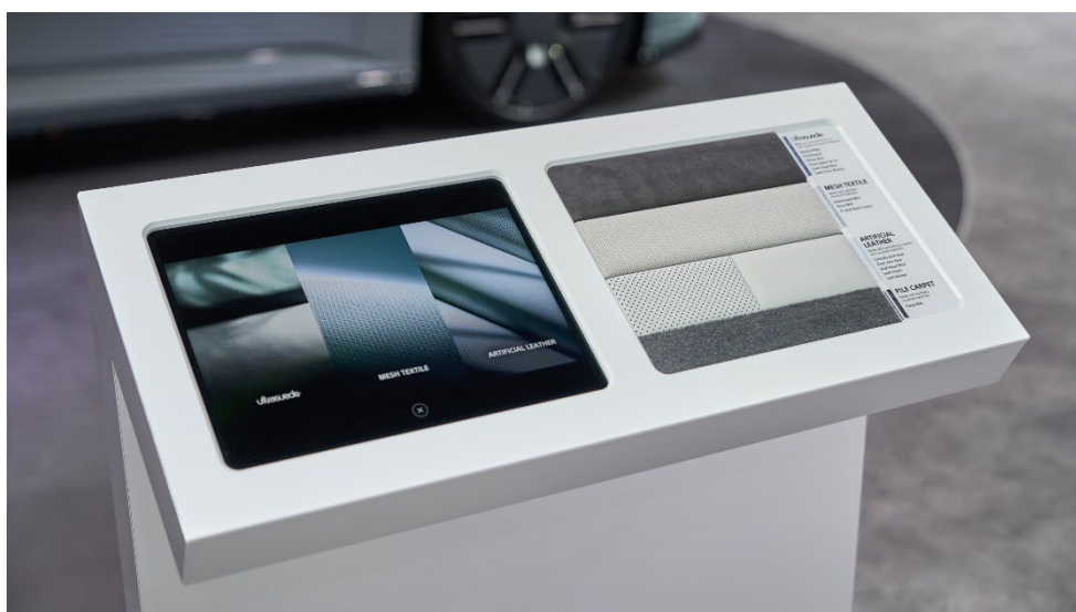
AFEELA の内装に使用している高品質な機能性素材を紹介する端末

ソニー・ホンダモビリティが CES® 2025 にて発表した報道資料およびプレスカンファレンスの様子は以下をご参照ください。1月7日（現地時間）に実施したソニー・ホンダモビリティのプレスカンファレンスのオフィシャル写真は本プレスリリースのアセットよりダウンロードできます。